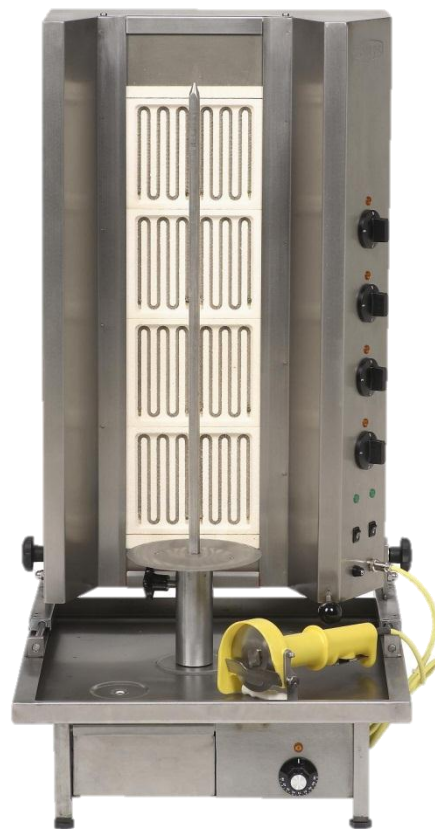
Serie "Poly EL MAXI"

Die Elektro-Grillgeräte eignen sich zum Herstellen von Gyros, Döner-Kebab sowie Shoarma. Sie sind geeignet für den Einsatz in Restaurants, Imbissen, Kantinen, Küchen und in mobilen Verkaufsfahrzeugen. Der Grillvorgang erfolgt mittels Poly-Infrarot-Strahler. Die Heizleistung wird mittels eines Viertaktschalters geregelt. Das vertikal gespießte Fleisch wird durch einen Antrieb, welcher sich je nach Geräteserie über bzw. unter dem Grillgerät befindet, so gedreht, dass es während der Grillperiode durch die Drehbewegung gleichmäßig gebräunt wird.